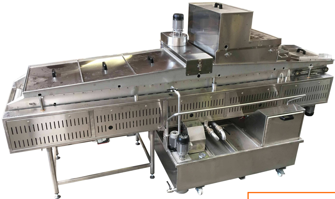
In figura Modello AR-100