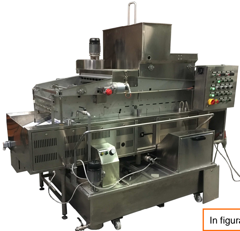
In figura Modello G-2460